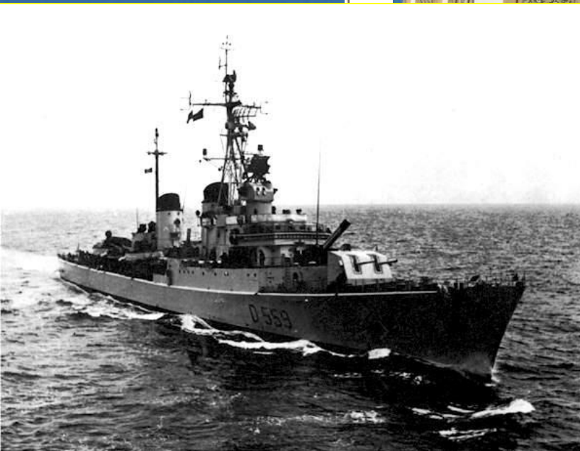
D 559 Ct Indomito