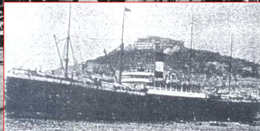
Nave Ospedale Campania